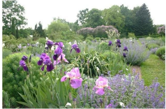
Trockenheitsverträgliche Pflanzen sind ein Schwerpunkt der Sichtungsgärten Weihenstephan

Sa, 15.6.2024: Vormittags Fahrt nach Freising und Fachführung durch die Sichtungsgärten Weihenstephan . In den Lehr- und Versuchsgärten werden Stauden- und Gehölzsportimente sowie Rosenneuheiten geprüft mit besonderem Augenmerk auf standortgerechte Verwendung in ästhetisch ansprechenden Kombinationen. Die Erklärungen gehen auch auf abwechslungsreiche Sommerblumenpflanzungen sowie Gestaltung und Pflege von Stauden und Gehölzern ein. 1947 gegründet, umfassen die Gärten auf mehr als 5 ha Beetstaudensportimente, Rabatte, steppenheideartige Pflanzungen, Steingartenanlagen, einen Teich und Wasserbecken. Mittagspause in der sehenswerten Altstadt von Freising.