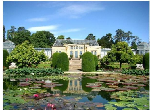
Die Wilhelma Stuttgart bietet einen zoologischen und botanischen Garten mit architektonischen Besonderheiten, hier Seerosenteich und Maurisches Landhaus.