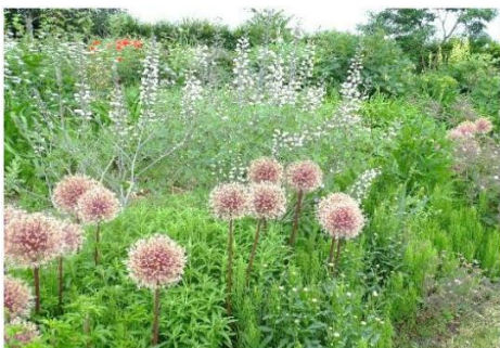
Staudengärtner Horst Bäuerlein und Dieter Gaissmayer sind Experten für Pflanzenraritäten

Anschließend geführter Stadtpaziergang durch Stuttgarts Innenstadt . Der Schlossplatz wird gesäumt von eindrucksvollen Säulenbauten und bietet einen guten Blick auf das barocke Neue Schloss. Sehenswert ist auch der weitläufige Schlossgarten mit seinen Skulpturen, Brunnen und Seen. Sie werden die Kessellage Stuttgarts spüren, denn es geht immer wieder über Stäffele (Treppen) bergan und bergab. ÜN im ****- Hotel Dormero in Stuttgart , ca. 8 km außerhalb des Zentrums, aber gut mit der U-Bahn angebunden. Das Hotel selbst verfügt über zahlreiche Bars. Abendessen im Hotel, als Buffet.